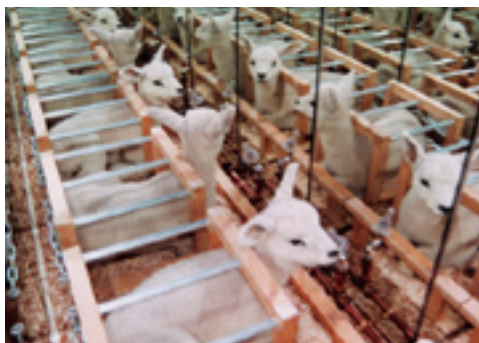
Farm set, Agneau animaux naturalisés, bois, miroirs, différents matériaux

L'ensemble est drôle, comme une bonne plaisanterie artistique. Peut-être trop drôle pour être honnête.