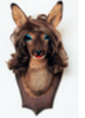
Tableaux de chasse têtes de biches naturalisées, perruques, maquillage

Présent dans toutes les œuvres de Pascal Bernier, l'humour noir est la marque de fabrique de cet artistique iconoclaste. Grave ou ludique, son humour joue sur plusieurs degrés. Les différents niveaux de lecture de ses œuvres proviennent souvent de la proximité entre le titre et sa traduction plastique. Les figures rhétoriques développées dans les titres y sont multiples : oxymore, polysémie, anacoluthie, métonymie, afin de décoder au mieux les comportements complexes de l'être humain.