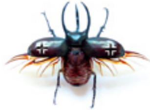
W.W.F insectes naturalisés, cocardes, acrylique

Pascal Bernier conserve l'esprit scientifique du cabinet de curiosité par une approche rigoriste qui emprunte aux techniques d'observation, de conservation et de présentation que l'on trouve dans les musées scientifiques. Toutefois, le recours à ces représentations très normées, dont la dimension objective et distante tranche avec le contenu, ajoute à la dimension satirique de ses œuvres.