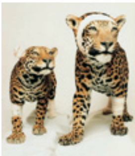
Accidents de chasse animaux naturalisés, bandage, acrylique

>> Mots clés : taxidermie, anthropomorphisme, exploitation, blessure