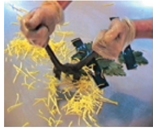
Flowers serial killer vidéo

La nature telle que nous la présente Pascal Bernier est désenchantée : elle est torturée, dénaturée, chassée, cultivée. On y découvre son aspect le plus trivial : la lutte pour la survie de l'espèce qui comprend aussi bien la reproduction, la sélection naturelle que la cohabitation avec l'homme. Les relations de dominations, qu'elles soient exercées entre les animaux ou avec les hommes, y sont omniprésentes.