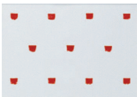
Niele Toroni Empreintes de pinceau n°50 à intervalles réguliers de 30 cm 1987 Acrylique sur papier 2 x 81 x 113 cm Coll. FRAC Bourgogne