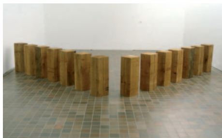
Carl André Phalanx 1981 14 billots de cèdre rouge 90 x 30 x 30 cm chacun Coll. FRAC Nord-Pas-De-Calais

Œuvres présentées au FRAC Poitou-Charentes