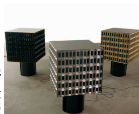
Didier Marcel Black, Silver and Gold 2001 Trois éléments indissociables, PVC thermoformé, plexiglas, moteur électrique Hauteur de chaque élément : 120 cm Coll. FRAC Poitou-Charentes