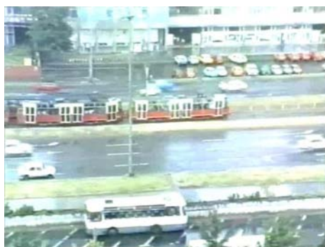
Josef Robakowski Cars, Cars 1985 Vidéo couleur, sonore, 3' Coll. FRAC Languedoc-Roussillon