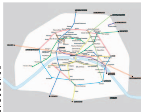
Pierre JOSEPH Mon Plan du Plan de Métro de Paris 2000 Impression numérique marouflée sur aluminium 170 x 135 cm Coll. FRAC Poitou-Charentes