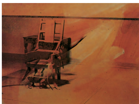
Andy Warhol Electric chairs 1971 Portfolio de 10 sérigraphies sur papier 90 x 122 cm l'une Coll. FRAC Nord-Pas-De-Calais