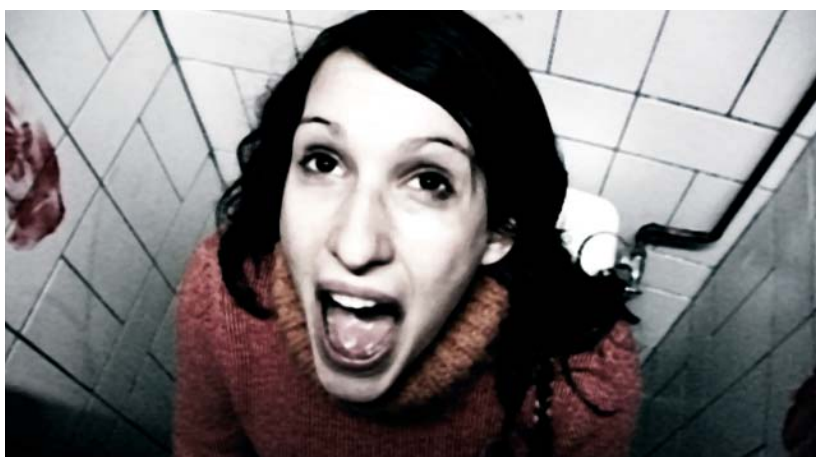
Alexis Chadefau Homo Accidentis

Le spectateur est invité à entrer dans un espace de déambulation, projection de ma maison d'enfance. Chaque pièce ou cellule est créée à partir de photographies d'intérieurs qui me sont étrangers. On se retrouve face à un temps suspendu, hanté par la solitude, l'intime, où se mêlent le dehors et le dedans pour se recueillir dans un silence habité. ”