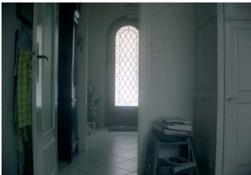
Clémence Brunet Ouvrez-moi vos maisons

“ Mon travail a commencé par la recherche d'espaces inconnus, étrangers, en allant chez d'autres, pour prendre en photographie une part de lui-même : l'intérieur de sa maison. Je m'approprie un espace qui n'est pas le mien, en mettant l'accent sur le lien des personnes avec l'intérieur de leur maison, sur les traces qu'ils y déposent ou sur mon ressenti, tout en m'attachant à la dimension esthétique de l'espace et de la lumière dans ces lieux retirés.