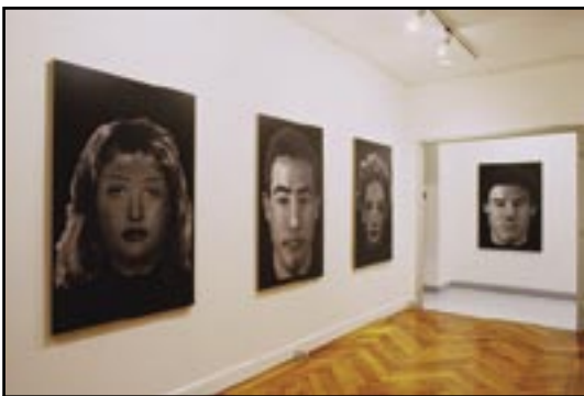
Les migrants 1998 impressions numériques

Par le biais d'une annonce publique intitulée «commandez votre portrait par téléphone», Slimane Raïs a recueilli l'auto-description des intéressés. Grâce à la manipulation d'un logiciel des services de la police judiciaire, il a reconstitué des portraits-robots.