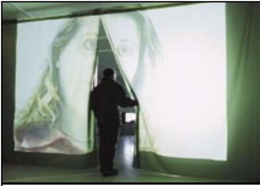
Ressources humaines 2001 installation vidéo

Pour la réalisation de cette pièce, Slimane Raïs est allé à la rencontre de personnes sans emploi par l'intermédiaire de l'ANPE ou d'agences d'intérim. Après une sélection de CV, il a proposé une série d'entretiens.