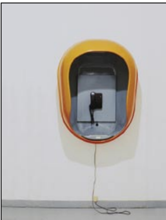
Pour parler 1998 installation / cabine téléphonique des années 70

Ce dispositif interactif, qui se présente sous la forme d'une cabine téléphonique, invite le spectateur à une conversation en tête à tête avec Slimane Raïs. En décrochant le téléphone, le visiteur entre en relation avec la ligne personnelle de l'artiste qui lui répondra selon ses disponibilités.