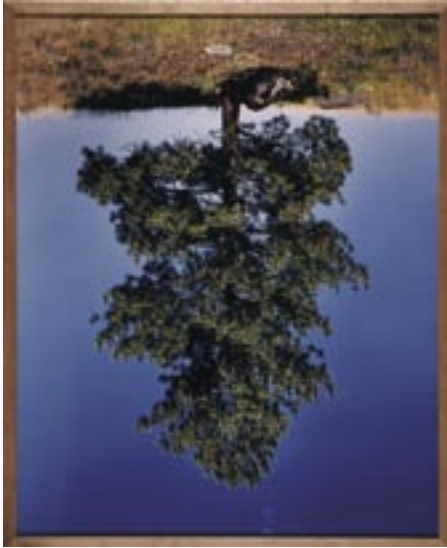
Tree, ponderosa pine II , 1991 photographie cibachrome 219 x 177,5 cm Collection FRAC Poitou-Charentes