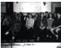
Dubbing , 1996 Installation vidéo - 1 vidéoprojecteur, 2 haut-parleurs. 1 bande vidéo PAL, couleur, son stéréo, 120' Collection FRAC Poitou-Charentes © Marian Goodman Gallery Paris/New-York

Pierre Huyghe « dé-filme » le cinéma en montrant ses conditions de production et souligne ainsi les enjeux qu'il soulève : « Le cinéma a colonisé le regard, induit des comportements, proposé des modèles de vie. Il ne faut pas seulement interroger le produit fini, mais les processus en amont et en aval de l'œuvre. » Dubbing met en scène des doubleurs, quinze comédiens en studio d'enregistrement, assis comme les musiciens d'un orchestre, essayant de lire synchrone les dialogues d'un film d'horreur qui défile sur la bande rythmo (film que l'on identifie assez vite comme étant Poltergeist ). Ce que l'artiste donne à voir ce sont les conditions de production, le tournage d'un doublage et les micro-événements qui s'y produisent : l'attente, la durée, les ratages, les gestes du corps et les mimiques du visage qui malgré tout apparaissent lors de la lecture du texte, les émotions qui font surface malgré la technicité de la tâche, les relations entre les comédiens, leur présence comme individus. Le spectateur assiste à la projection donnée seulement pour les doubleurs ; les doubleurs, avec leurs hésitations, omissions et cafouillages, en deviennent les seuls interprètes ; chacun devient le double de l'autre : le spectateur double les doubleurs, qui, eux, doublent les acteurs qu'ils voient sur un écran qui demeure invisible.