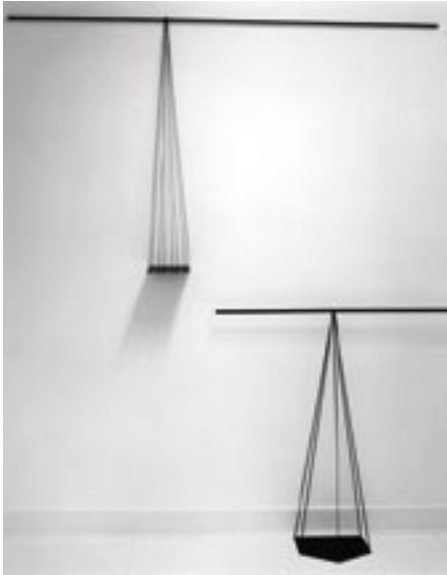
Point de Vue , 1983-84 fer et cordelette 100 x 99 x 30 cm et 177 x 100 x 15 cm Collection FRAC Poitou-Charentes