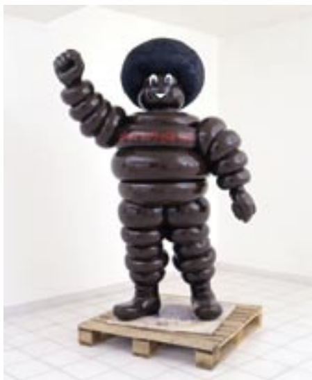
The Big One World , 2000 résine moulée H : 200 cm Collection FRAC Poitou-Charentes