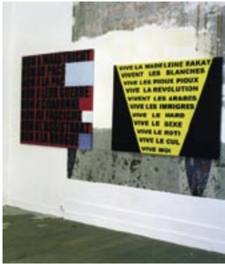
NON , 2001 photocopies couleur marouflées sur toile 120 x 130 cm Collection FRAC Poitou-Charentes