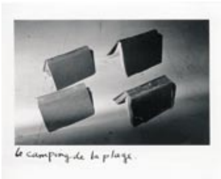
Le camping de la plage , 1982 photographie N&B 50 x 60 cm collection FRAC Poitou-Charentes © Joachim Mogarra

(issue de la série Images du monde, 1982-1985)