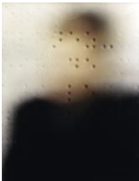
Portrait Braille n° 1 , 1985 photographie cibachrome 130 x 100 cm Collection FRAC Poitou-Charentes

Évacuant tout aspect documentaire ou illusionniste, Patrick Tosani fabrique des images, tout en laissant transparaître le processus employé, qu'il adapte en fonction de la nature des choses. L'image obtenue n'est que le moyen de questionner, d'analyser et de comprendre l'essence et la complexité du monde qui nous entoure.