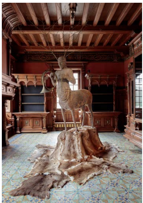
Printemps (Cerfaure), 2013