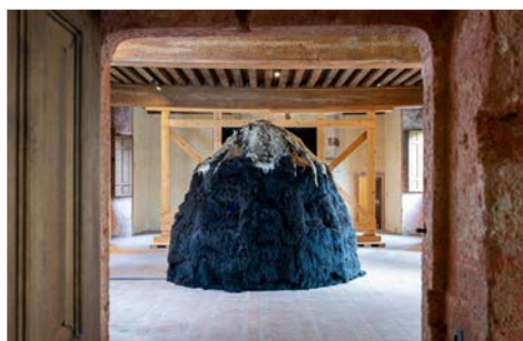
Nuit étoilée (Mont aux merveilles), 2017