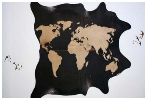
Peau de vache Mundi (continents crèmes, océans noirs), 2023